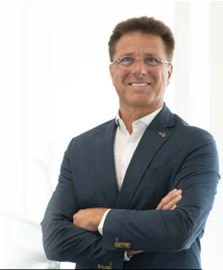
Werner Baumann, Bürgermeister

Egal ob Webseite, Facebook, Instagram oder Cities App: Über alle Veranstaltungen informieren wir auch online und direkt aufs Smartphone oder den Desktop-PC. Wie das klappt? Ganz einfach: Wird die