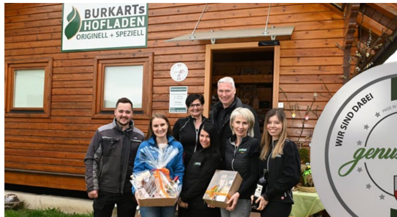
Das Team von Burkart's Hofladen bringt regionale Köstlichkeiten auf den Tisch, nicht nur zu Ostern, sondern das ganze Jahr und mit Genuss 10er auch besonders preiswert!

Wie zum Beispiel von Burkart's Hofladen in Windorf, der seit über 10 Jahren Feinschmecker mit Köstlichkeiten aus unserer Gemeinde und der Region versorgt. Infos zu den Angeboten des Hofladens: www.burkarts-hofladen.at